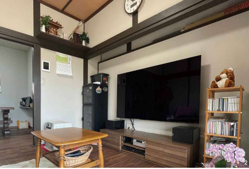
1. 足触りのよい無垢フローリングを採用。地袋と襖を一新した上質感漂う玄関スペース 2. 深みのあるブラックウォールナットで空間を引き締めた和モダンリビング。砂壁の塗り替えと天井の張り替えで明るく生まれ変わった 3. 石目柄の床とモダンな腰壁、システムキッチンのトーンを合わせて統一感のある仕上がり 4. 押し入れは機能的な可動棚を設え、アクセントクロスを張って遊び心のあるパントリーに大変身